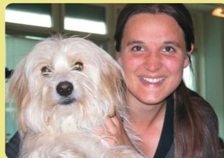
Zipfel mit seiner neuen Besitzerin.

Der kleine Hund hatte ein unwahrscheinliches Glück, dass er nicht innert kurzer Zeit von einem Auto oder Lastwagen überfahren wurde, sondern von einer hilfsbereiten,