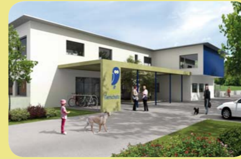
Virtuelle Ansichten des neuen Tierzentrums (Computerbilder)

www.bernertierschutz.ch info@bernertierschutz.ch Spendentelefon: 031 926 64 64, Spendenkonto: PC 30-31879-8